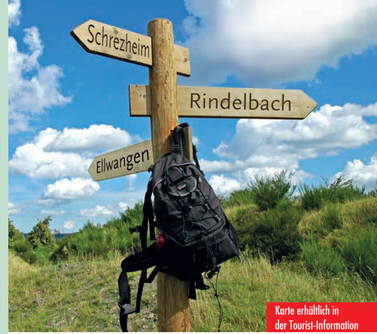
Karte erhältlich in der Tourist-Information